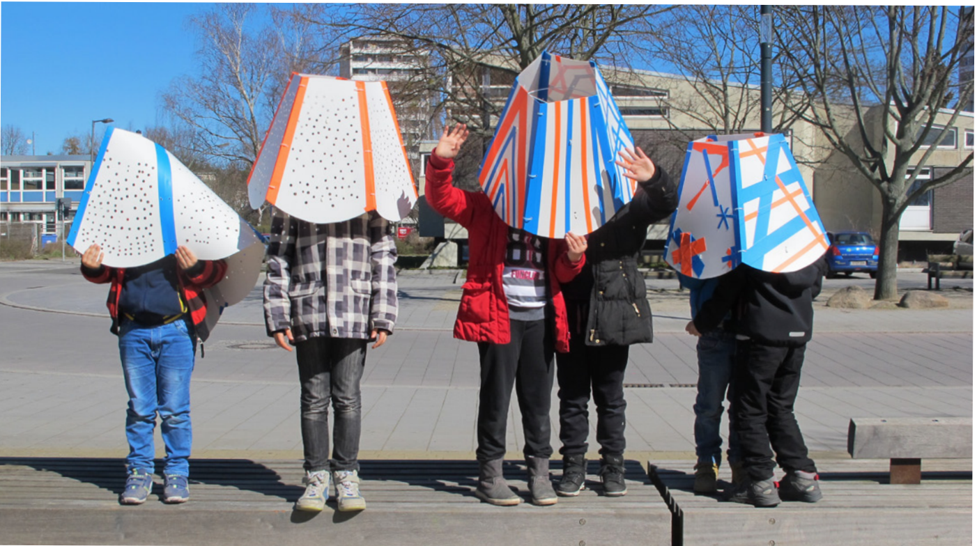
WORKSHOPS MIT GRUPPEN AUS DEM KIEZ