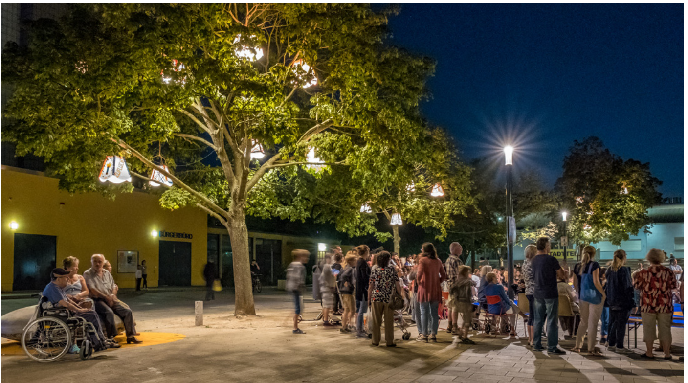
DIE 40 LAMPEN AUF DEM PLATZ AM ABEND DER ERÖFFNUNG